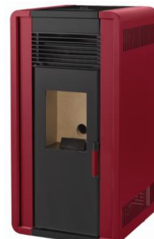
ii) e iiiii)