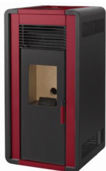
ii) e iiiii)

i) Branco/ Blanco/ White/ Blanc/ Bianco - ii) Bordeaux/ Burdeos/ Bordeaux/ Bordeaux/ Bordò - iii) Cinza/ Gris/ Grey/ Gris/ Grigio - iiiii) Preto/ Negro/ Black/ Noir/ Nero - iiiiii) Carvalho/ Roble/ Oak/ Chêne/ Quercia