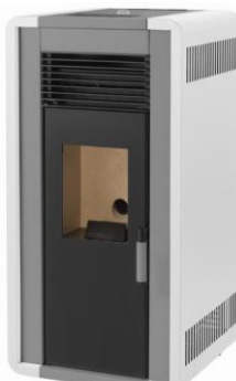
i) e iiiii)