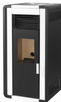
i) e iiiii)