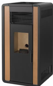
iii) e iiiiii)