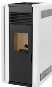
i) e iiiii)